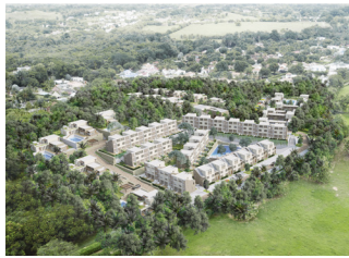
CONJUNTO CORTIJO RESERVADO