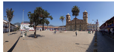
PLAZA DE LOS COMUNEROS - ZIAPAQUIRA

Plan de Manejo Ronda del Río Tunjuelo - Acueducto de Bogotá | Bogotá, Colombia | 2003 - 2004 Peatonalización Avenida Colombia - Spratt Bight | San Andrés Isla, Colombia | 2003 - 2004 Pabellón Urbanización Miramar | Barranquilla, Colombia | 2003 Parque Urbanización Fontana Real | Bucaramanga, Colombia | 2002 - 2004 Plaza de Bolívar, Parque Santander, Parque Santa Rita | Facatativá, Colombia | 2002 Parque del Agua | Bucaramanga, Colombia | 2002 - 2004 Intervención Urbana Centro Histórico de Zipaquirá | Zipaquirá, Colombia | 2001 - 2004 Bogotá | Octubre de 2001 - Mayo de 2004