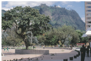
PLAZA DE LA REBECA

Bogotá | Septiembre de 1997 - Abril de 1998