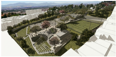
PARQUE ZONAL CASABLANCA